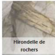
Hirondelle de rochers