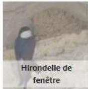
Hirondelle de fenêtre