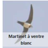
Martinet à ventre blanc

Vous pouvez modifier ici le choix de l'espèce, au besoin